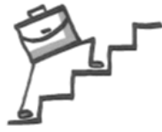
Beruflicher Aufstieg-Karriere Professional Advancement-Career