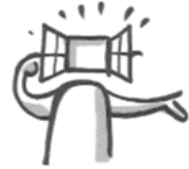
Offenheit-Lernbereitschaft Openness-Willingness to learn