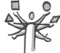
Multi-Tasking-Fähigkeit Multitasking skills