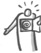
Fähigkeiten entdecken Discover capabilities