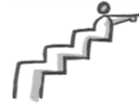
Persönliches Wachstum-Entwicklung Personal growth-Development