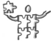
Aspekte der Identität-Ebenen der Persönlichkeit-Kapazitäten Aspects of identity-Ebenen of personality-Capabilities