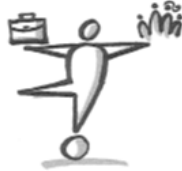
Work-Life-Balance Work-life balance